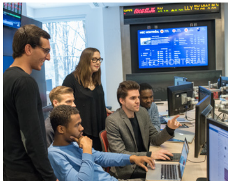
La salle des marchés