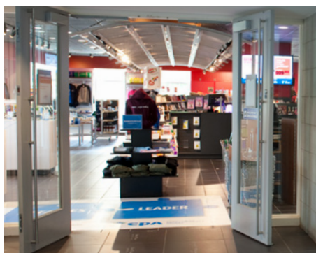
La Coop HEC Montréal