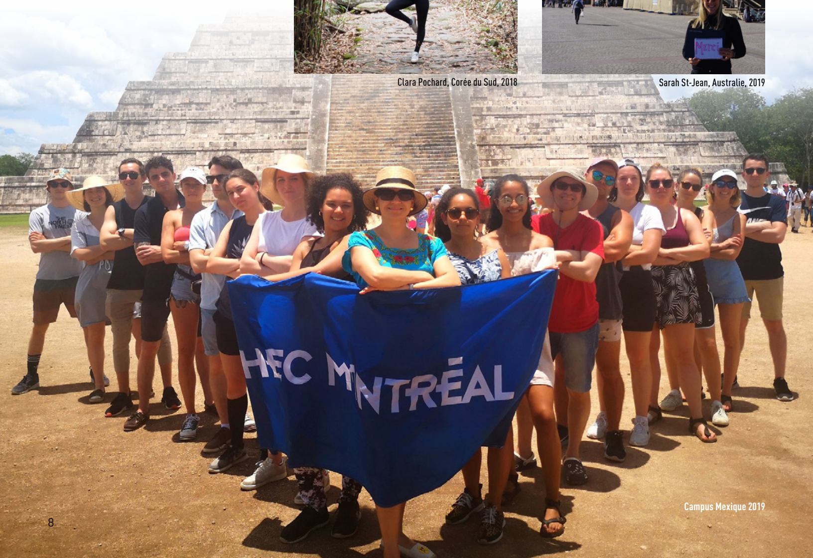
Campus Mexique 2019