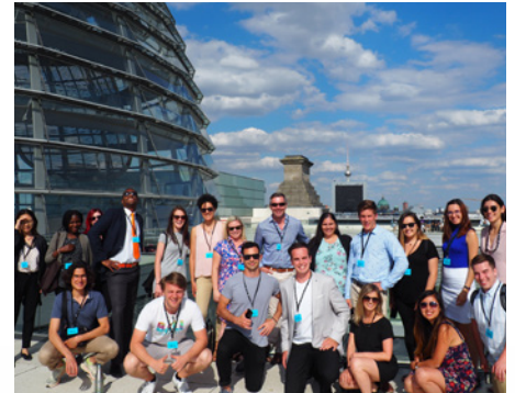
Campus Allemagne 2019